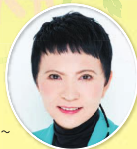
講師: いえだ しょうこ 家田 莊子 氏