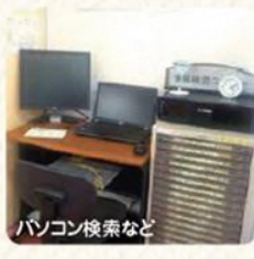
パソコン検索など